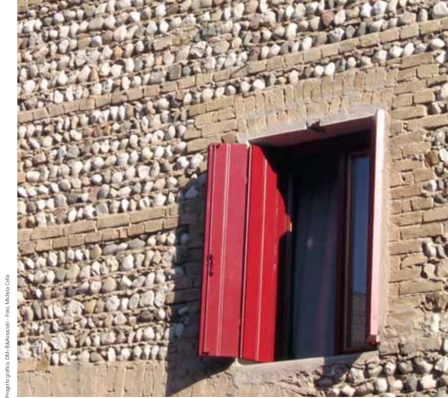
Progetto grafico: DM+BBAssociati